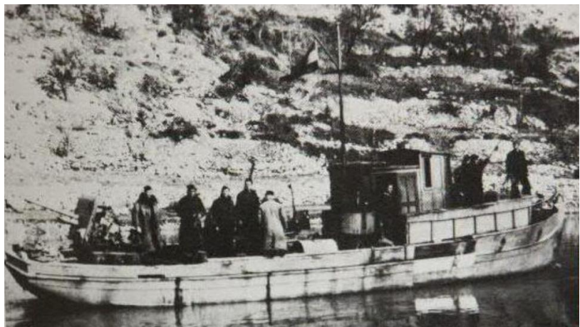
PČ (Patrolni Čamac) 1 “Jadran” je imi stalnu posadu ud 11 ljudi.

“Jadran” ili PČ 1 je idun ud dvua ribarska broda kočarice priurejen za ratne prilike ki je doša na Ist pun partizano zarobiti Njemci ki su bili va škuli. Drugi je moga biti “Macola” ili PČ 2. Idun i drugi su bili va sastavu II Pomorskoga Obalnoga Sektora vojske Jugoslavije.