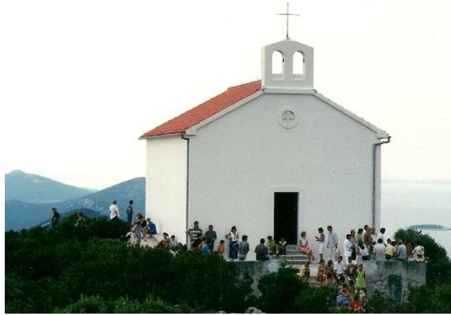
Na Struazi (174 m) usprid crkvice prije svete mise na peti agusta za Gospu ud Sniga.

Zavjetna crkvice posvećena Gospi ud Zdravljica uzdole se je va valici “Pukozji” uzgor Ista dugudila havarija i kade je putunu vaponiće. Sveta misa se cini dvua puta na gudišće, peti agusta za Gospu ud Sniga kad je i išćunska fešta i 21 nuvimbra za Gospu ud Zdravljica.